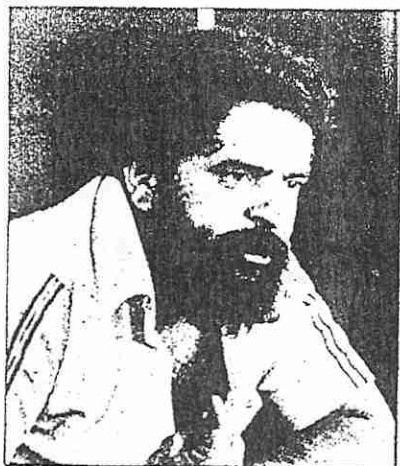
Lula pelo PT e ...

Com as vindas de Luís Inácio da Silva, o Lula (PT) e Ulysses Guimarães (PMDB) oficializaram-se em Parnaíba, o Partido dos Trabalhadores - PT e o PMDB - Partido do Movimento Democrático Brasileiro.