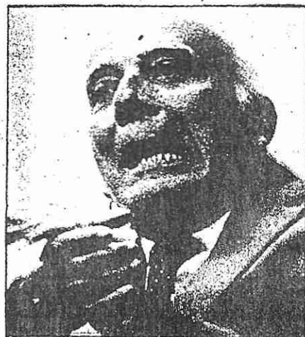
Ulysses PMDB, em Parnaíba

O primeiro foi divulgado em concentração pública que reuniu 3.000 pessoas dia 29 de agosto p.p. no bairro São Francisco da Guárita. O segundo, em comício, na Praça da Graça, dia 14 do mesmo mês.